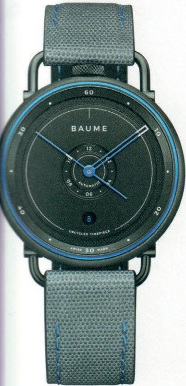
Ocean Boîtier de 42 mm de diamètre en aluminium et polypropylène recyclé, bracelet en PET recyclé, mouvement automatique. Baume & Mercier

The watchmakers have also become increasingly committed to eco-responsibility through recycled bracelets, bio-sourced materials and biodegradable packaging.