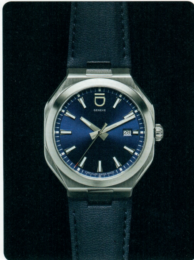
Circular 1 Boîtier de 41 mm de diamètre en acier recyclé à 100 %, bracelet fabriqué à partir de végétaux, mouvement automatique. ID Genève.