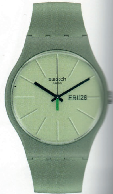
We in the kitchen Boîtier de 41 mm de diamètre, bracelet, passant et boucle en matériaux biosourcés, fabriqués à partir d'écailles de graines de ricin, mouvement à quartz, packaging 100% biodégradable. Swatch